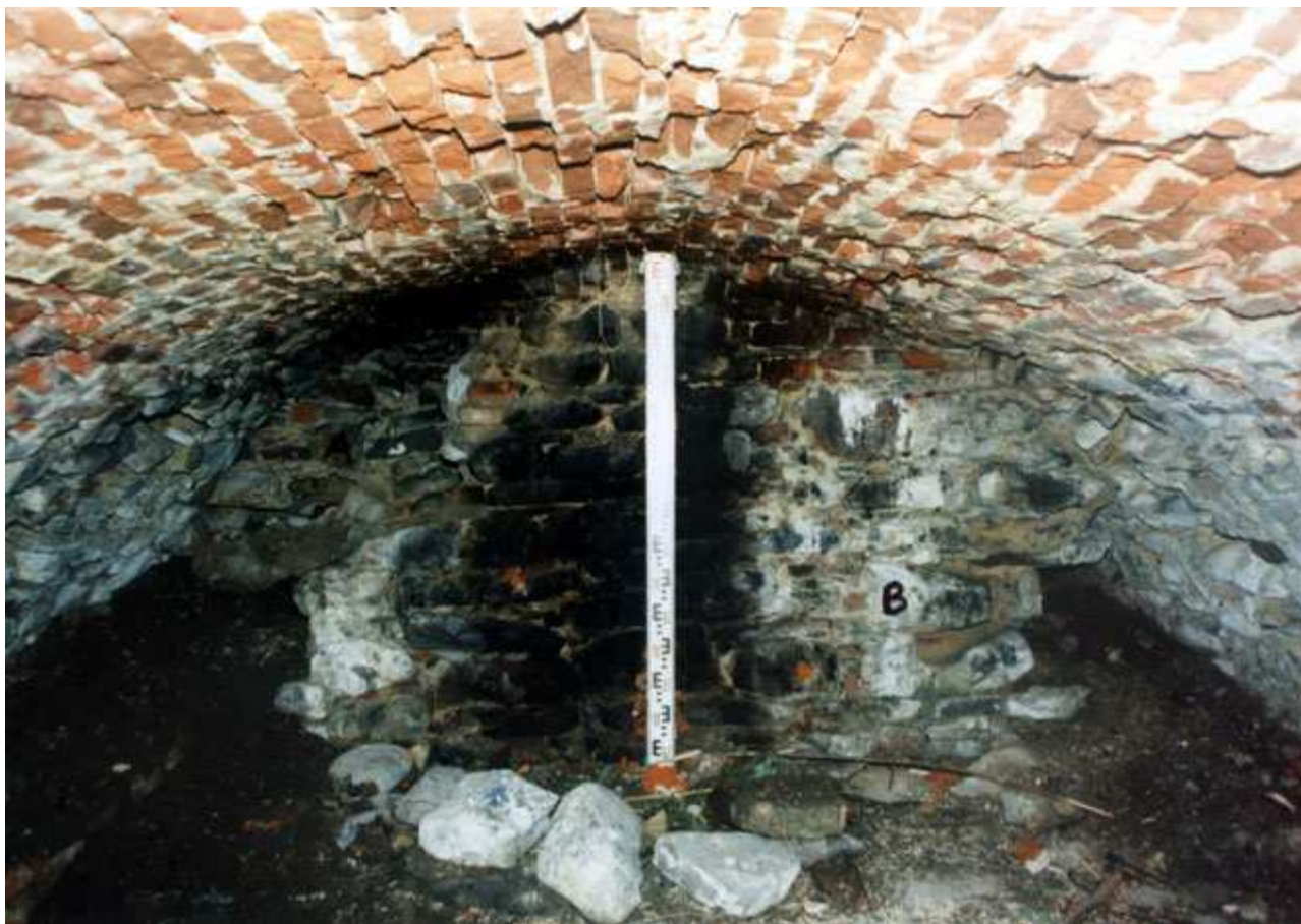
Białaczów – dwór na kopcu. Pomieszczenie 2 – północna część wnętrza. Widok od południa.

O bogatej historii Białaczowa świadczy jednakże nie tylko wspomniany pałac. Zachował się również pierwotny układ urbanistyczny dawnego miasta. W przypałacowym parku nad niewielkim dopływem rzeki Wąglanki, znajduje się otoczony wodą kopiec, zwany przez miejscową ludność „Wyspą Kochanowskiego”, gdyż z Białaczowa wywodziła się matka naszego wielkiego poety. I właśnie tu usytuowane są ruiny dawnego dworu. Obiekt manifestuje się dzisiaj w terenie jako owalny w rzucie kopiec ziemny, otoczony częściowo nawodnioną fosą. W centralnej części górnego plateau znajdują się relikty murowanego budynku tworzące ciąg pomieszczeń o wymiarach 12x22 m, uzupełniony od północnego–zachodu prostokątnym w rzucie aneksem. Podczas przeprowadzonych w roku 1997 wykopalisk archeologicznych ustalono funkcję oraz wstępnie określono chronologię obiektu. Pozyskano także dużą ilość ruchomego materiału zabytkowego, łącznie 3473 przedmiotów, z czego najliczniejszą grupę stanowiła ceramika naczyniowa – 2975 fragmentów.