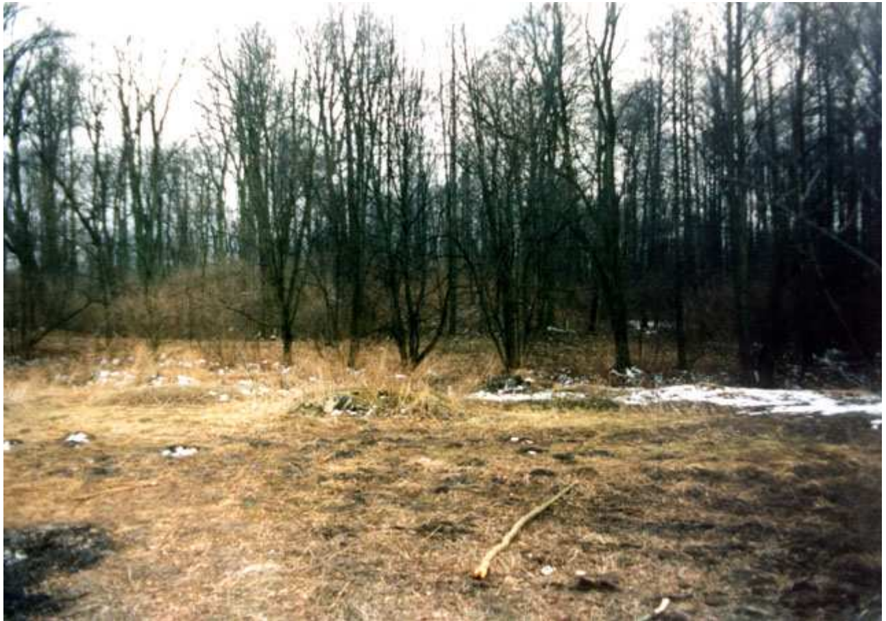
Białaczów – dwór na kopcu. Stan przed rozpoczęciem badań archeologicznych (zima 1997 r.). Widok od wschodu.

W mniejszych ilościach wystąpiły kafle piecowe, zabytki szklane i metalowe oraz destrukty kości zwierzęcych. Na podstawie analizy zabytków ruchomych określono początek użytkowania nasypu ziemnego na okres późnego średniowiecza (XIV wiek). Nie natrafiono jednak na żadne ślady budowli z tego okresu. Takie datowanie potwierdzają również źródła pisane, gdyż „castrum” białaczowskie wzmiankowane jest po raz pierwszy pod rokiem 1385. Natomiast powstanie murowanego dworu należy wiązać z połową XVI stulecia, kiedy to Białaczów znajdował się w rękach Kacpra Kochanowskiego (syna Anny Białaczowskiej i Piotra Kochanowskiego). Początkowo była to kamienica o wymiarach 12x15 m. W XVII wieku, zgodnie z rosnącymi potrzebami użytkowymi, dwór rozbudowano do formy zbliżonej w rzucie do litery „L”. Tenże obiekt wzmiankowany był w dokumencie z 1671 roku i określony jako „zameczek”. Po wybudowaniu klasycystycznego pałacu, na początku XVIII stulecia, dwór został opuszczony przez mieszkańców, a następnie pełnił funkcję lodowni–spizarni.